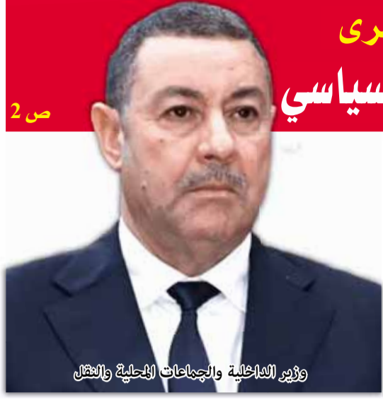
وزير الداخلية والجماعات المحلية والتهيئة