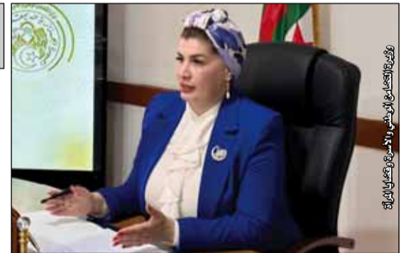
رئيسة المجلس الوطني والأسرة وقضايا المرأة

أكدت وزيرة التضامن الوطني والأسرة وقضايا المرأة، صورية مولوجي، أن رعاية المسنين ستظل في صميم اهتمامات الدولة التي تعمل على مواصلة تطوير البرامج وتحسين الخدمات الموجهة لهذه الفئة. وأوضحت الوزيرة، في تصريح إعلامي، أن الدولة تولي عناية خاصة لفئة الأشخاص المسنين باعتبارهم جزء من نسيج المجتمع وركيزة من ركائز الذاكرة الوطنية، مشيرة إلى أنه تم تجسيد هذا الاهتمام من خلال برامج وآليات اجتماعية تهدف إلى ضمان العيش الكريم لهم في ظروف تحفظ كرامتهم وتصور حقوقهم.