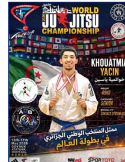
ممثل المنتخب الوطني الجزائري في بطولة العالم