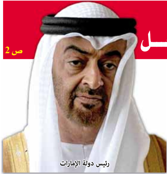
رئيس دولة الإمارات