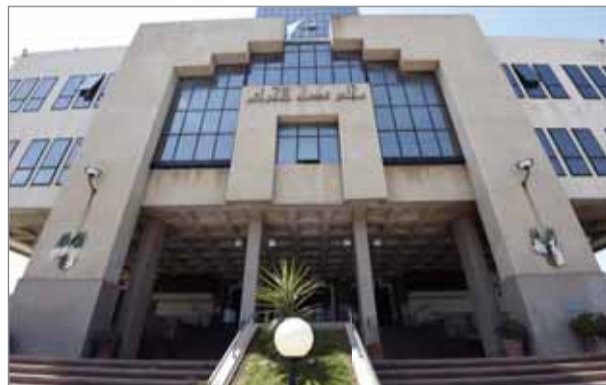
الاسترجاع enr، "ص.ش" مدير المالية بسيدار الحجار زيادة بالحكم بالبراءة لرئيس مصلحة وشركة تأمينات. وكان المتهمون في هذه القضية التي هزت الرأي العام منذ 3

سنوات، قد وجهت لهم تهم منح امتيازات غير مبررة للغير بمناسبة إبرام عقد أو صفقة مع الدولة أو إحدى مؤسساتها على نحو يخرق القوانين والتنظيمات، تبييض الأموال والعائدات الإجرامية عن طريق تحويل الممتلكات أو نقلها أو تميته الطبيعية الحقيقية لها أو مصدرها أو مكانها أو كيفية التصرف فيها في إطار جماعة إجرامية وباستعمال التسهيلات التي يمنحها النشاط المهني والتبديد العمدي لأموال عمومية وجنحة إساءة استغلال الوظيفة.