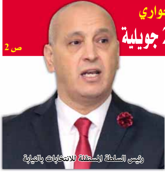
رئيس السلطة المستقلة للانتخابات والنيابة