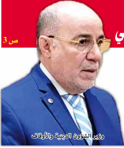
وزير الشؤون الدينية والأوقاف